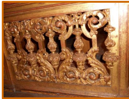
Voici un détail de la barrière de communion.

Toutes ces photos ont été transmises à l'entreprise Aristeas qui réalise notre étude de reconstitution virtuelle de l'abbaye d'Abbecourt afin de les aider pour la reconstitution du mobilier d'époque.